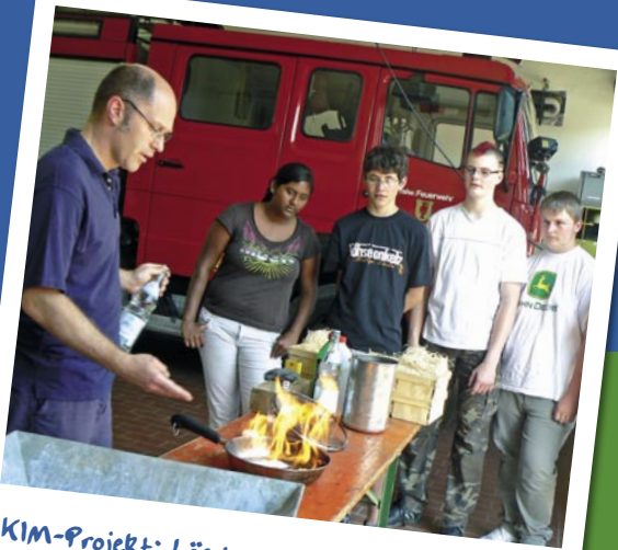
KIM-Projekt: Löschen von Entstehungsbränden bei der Feuerwehr Kandern