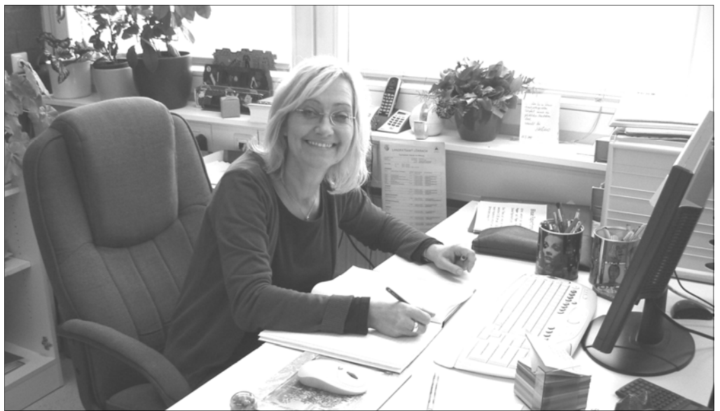
Unsere Konrektorin beim Arbeiten an ihrem Schreibtisch